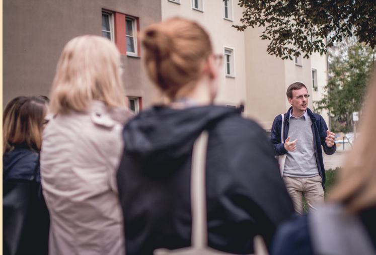
Stadtrundgang zur Friedlichen Revolution | Jena 2018

Neben Briefen, Gedächtnisprotokollen, Tagebüchern und Fotos enthalten unsere Bestände Plakate, Flugblätter, Untergrundzeitschriften, Musik- und Veranstaltungsmitschnitte und Schriftgut von unangepassten Gruppen und Netzwerken.