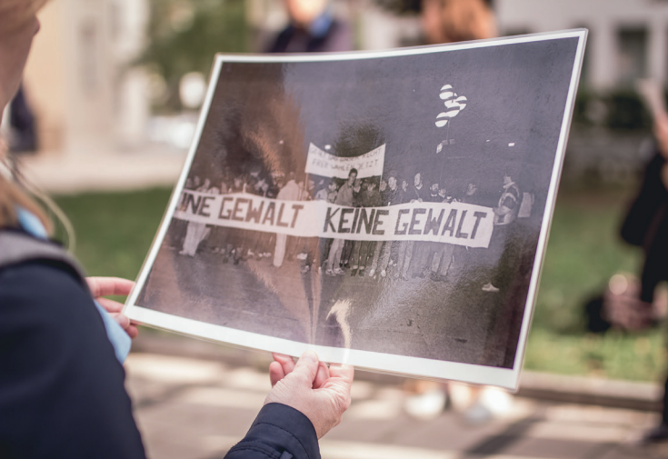
Stadtrundgang zur Friedlichen Revolution | Jena 2018 | Quellenfoto: Demonstration im Herbst 1989