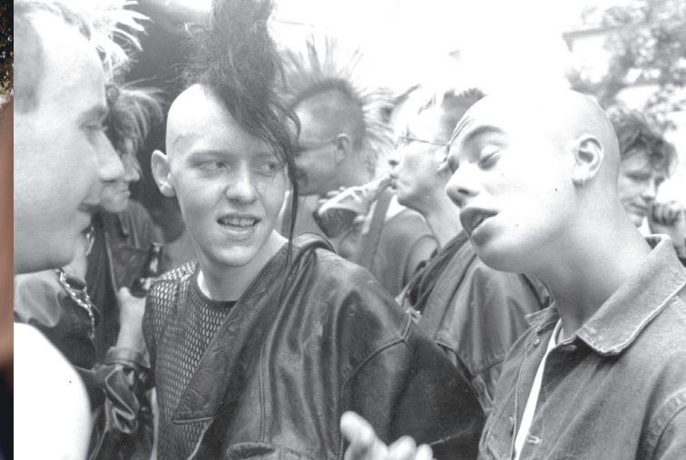
Jugendliche beim Festival der Offenen Arbeit „Jugend 86“ | Rudolstadt 1986