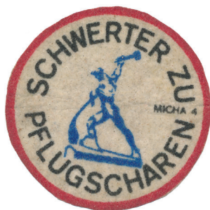
Vliesaufnäher „Schwerver zu Pflugscharen“ | ThürAZ, Sammlung Thomas Grund

Die Schüler*innen bekommen Zugang zu Perspektiven ‚von unten‘ auf die Geschichte der DDR. Sie lernen Gegenüberlieferungen zu Quellen aus dem staatlichen Herrschaftsapparat der DDR kennen und erfahren, dass historische Ereignisse und Prozesse sich subjektiv unterschiedlich auswirkten.